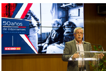
Página 5. 50 aniversario de Interramas de CCOO