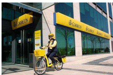
Página 2. Federaciones