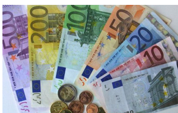
Página 4. Breves sociolaborales