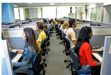
Página 3. Huelga del sector del contac center