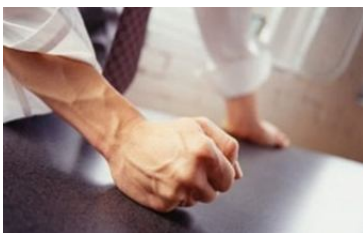
Página 4. Federaciones