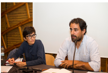
Página 2 y 3 . Escuela sindical en Morillo de Tou