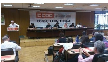
Página 5. Consejo confederal de Comisiones Obreras