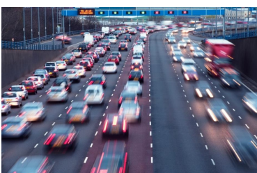
Página 4. Breves sociolaborales