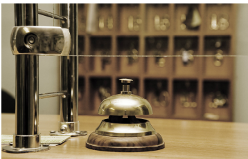
Página 2. Federaciones