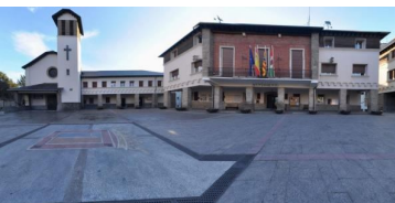
Página 4. Trabajadoras de limpieza de Sabiñanigo