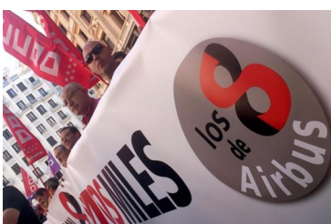
Página 5. La OIT constata la represión del derecho a huelga