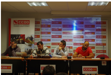
Página 2. Federaciones