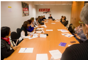
Página 3. Contra el acoso sexual en el trabajo