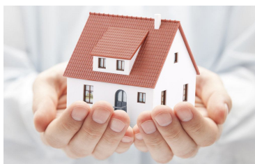
Página 3. CCOO te asesora con tu hipoteca