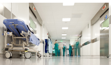
Página 4. Más personal y mejor Planificación en urgencias