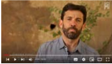
Enrique Pueyo, alcalde de L'Ainsa