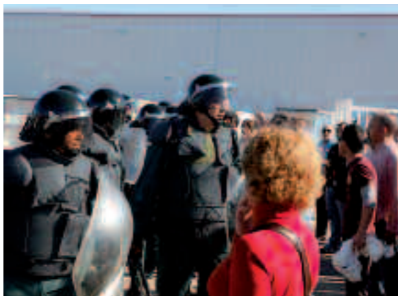
La Guardia Civil se enfrentó con los trabajadores.

Salvado el primer impacto de la crisis con esta medida, el Comité de Empresa entendió que el ajuste de empleos no tenía nada que ver con la coyuntura económica y sí con una reestructuración de la compañía, y planteó una huelga de siete días entre el 3 y el 11 de noviembre. Ante la posibilidad de una falta de abastecimiento en los asientos del Corsa (el sistema just in time ha eliminado cualquier tipo de stock), la empresa respondió con una maniobra antieconómica y antisindical: hacer traer piezas de Alemania y almacenarlas en