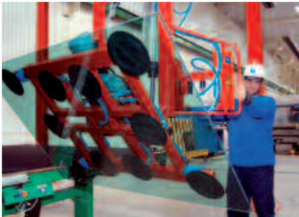
Algunos empleados pueden acogerse a traslados.

La plantilla acordó en asamblea la convocatoria de cinco días de huelga los días 20, 26 y 27 de octubre y 3 y 4 de noviembre. Sin embargo, desde la multinacional francesa antepusieron su deseo de reorganizar la producción y ahorrar costes, poniendo sobre la mesa la única opción de negociar las indemnizaciones. Finalmente, éstas han quedado fijadas en 50 días por año trabajado sin límite de mensualidades y se ha abierto la posibilidad de recolocar a 30 de sus 59 empleados en las plantas de Asturias, Cantabria, Tarragona y Madrid. ■