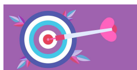
LOS OBJETIVOS DE NUESTRO PACTO