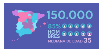
DATOS SOBRE EL VIH Y ESTIGMA EN ESPAÑA

Muchas gracias por vuestra colaboración, un cordial saludo, OMSIDA